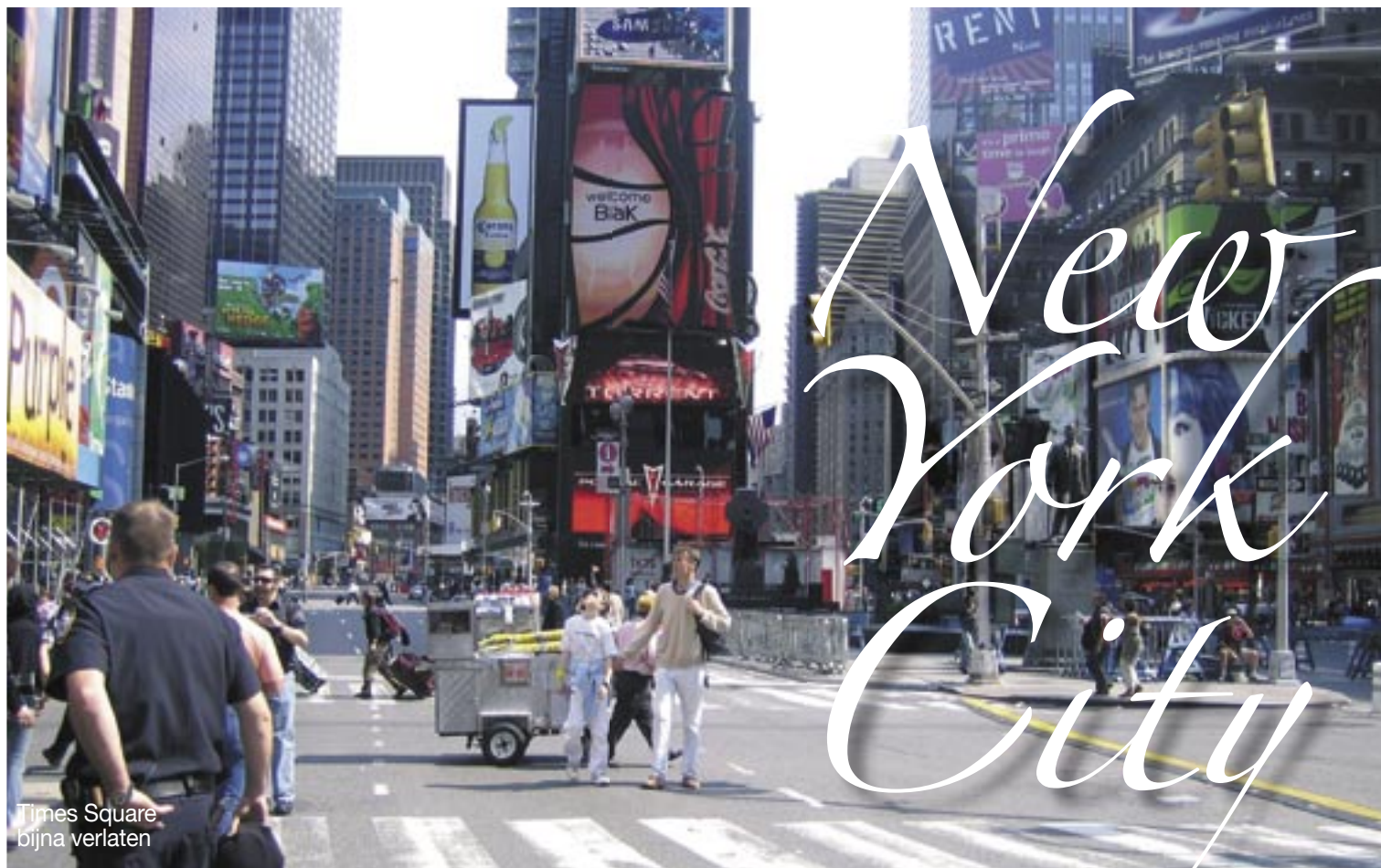
Times Square bijna verlaten