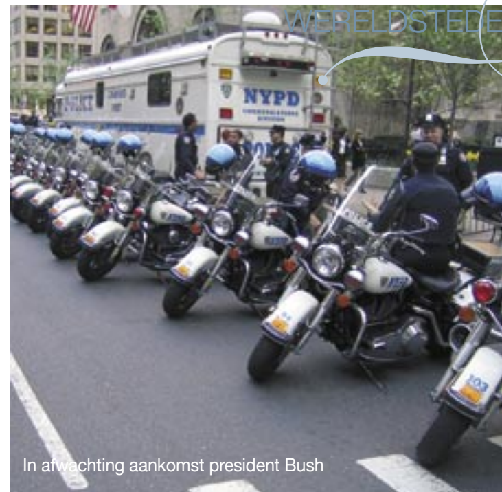
In afwachting aankomst president Bush