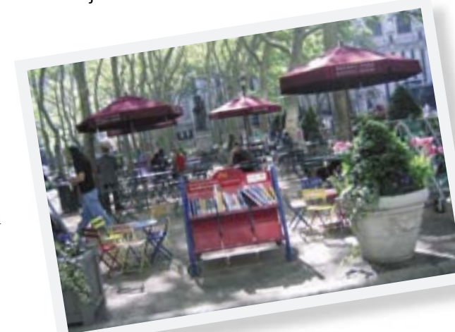
Bryant Park Reading Room

Analfabetisme, verslaving, werkloosheid en criminaliteit blijven hot issues . Om alle inwoners