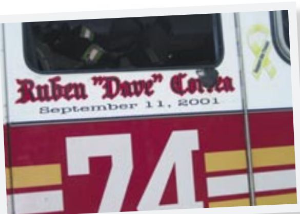
Naam van omgekomen collega op brandweerauto